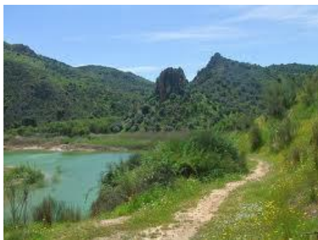
Ruta del Tempranillo

DÍA 30/5. Ruta del Tempranillo. En la localidad de Jauja nació el veintiuno de junio de 1.805 José María Pelagio Hinojosa Cobacho, más conocido como José María "El Tempranillo", máxime exponente del bandolerismo andaluz. Sólo nos separan 18 Km desde el camping, y hasta allí nos desplazaremos para hacer la ruta que lleva su nombre. La ruta tiene 11,5 Km y al terminar visitaremos el Centro Temático del Bandolerismo de Jauja. También nos daremos una vuelta por Badolatosa, junto a Jauja por donde el famoso bandolero tenía situado su cuartel general. http://www.destinobandolero.com/