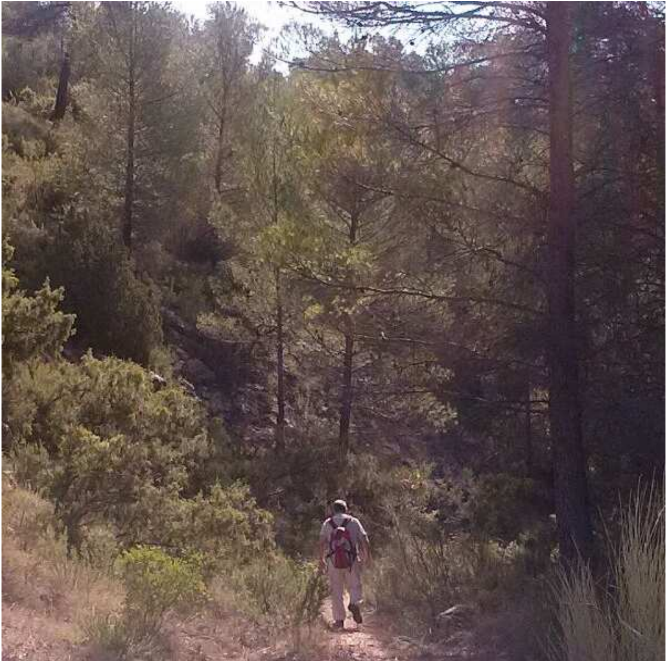
La intrincada rambla de la Fuente de la Parra