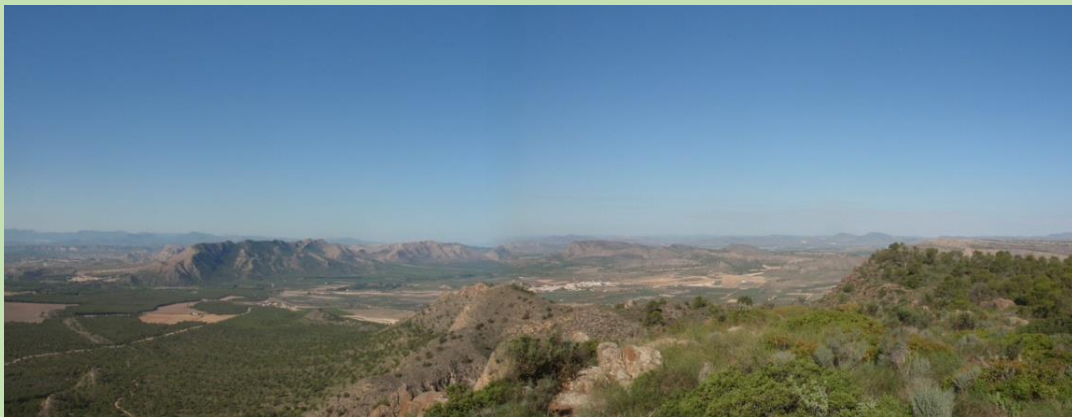
Amplias vistas desde la cima del Pitón