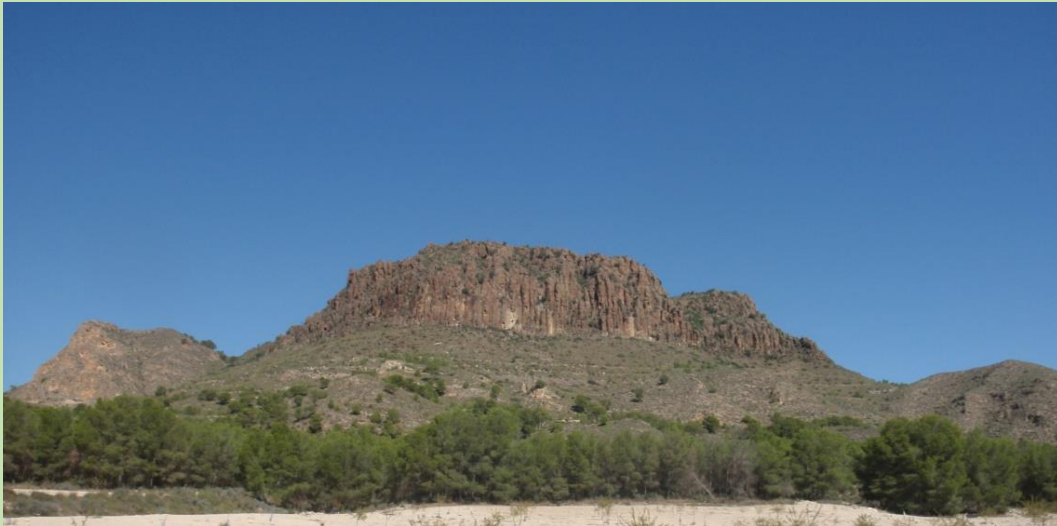
Vista general del Pitón de Cancarix, desde la llanura

Entre 8.5 y 6,5 millones de años, durante el periodo geológico del Mioceno Superior, tuvieron lugar en esta sierra las erupciones volcánicas cuyo exclusivo y raro material denominado Lamproita (naturaleza ultrapotásica, con muy pocos ejemplos en Europa), consecuencia del avance del magma, formó la impresionante columna central elevada 150 metros sobre la llanura que la circunda y 1,5 Km. De diámetro, en disyunción columnar, como consecuencia de la retracción del magma al enfriarse, que hoy podemos contemplar tras la acción de la erosión sobre los materiales blandos.