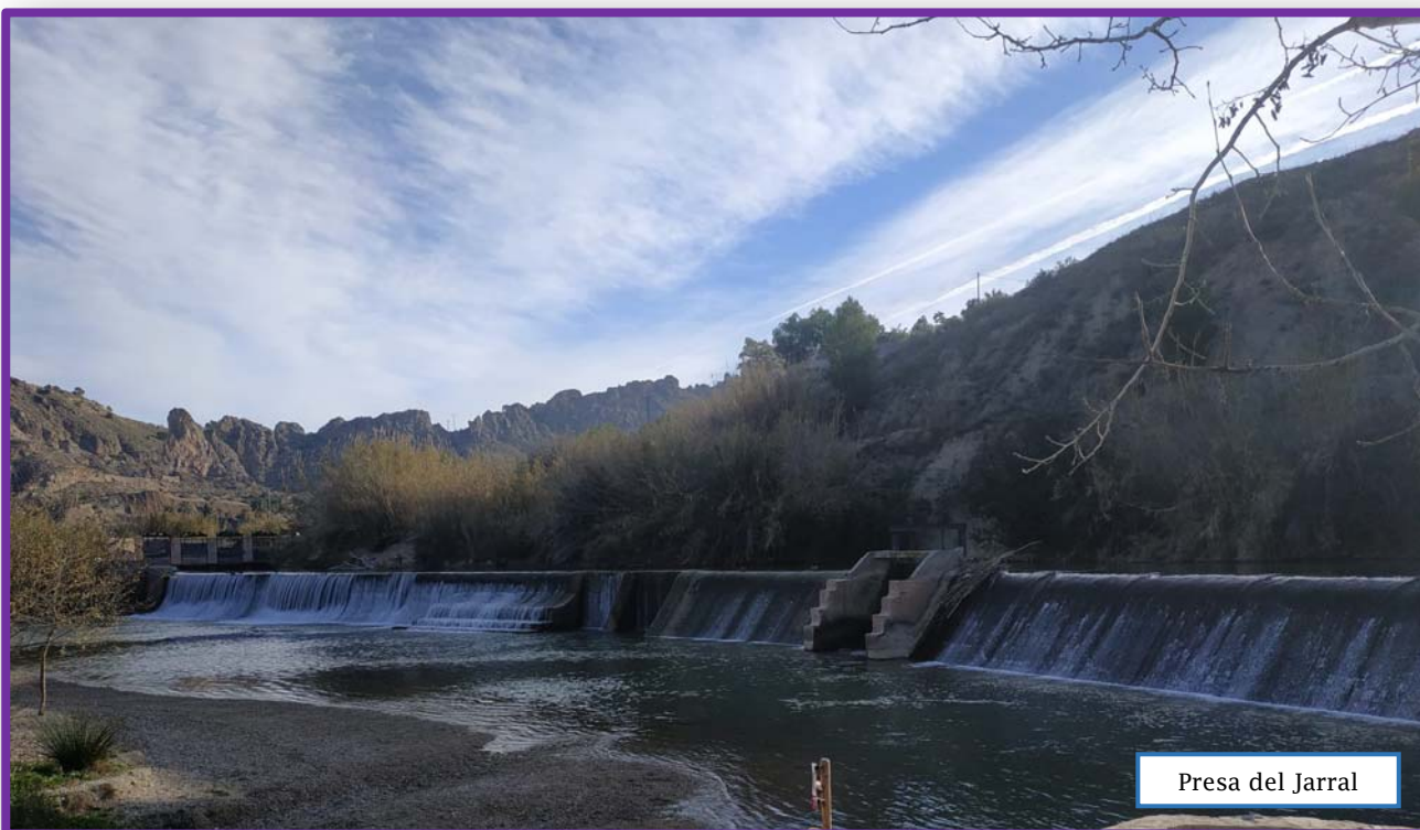
Presa del Jarral