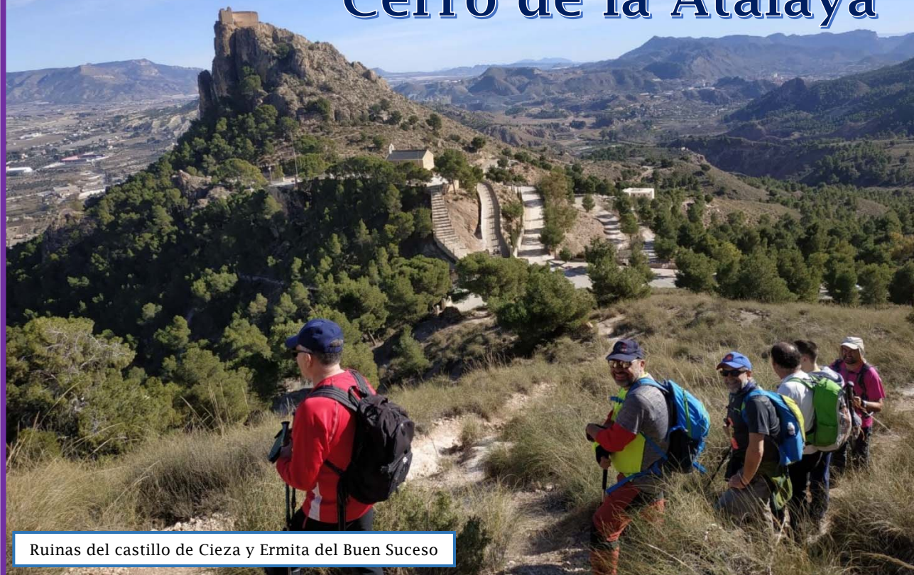
Ruinas del castillo de Cieza y Ermita del Buen Suceso