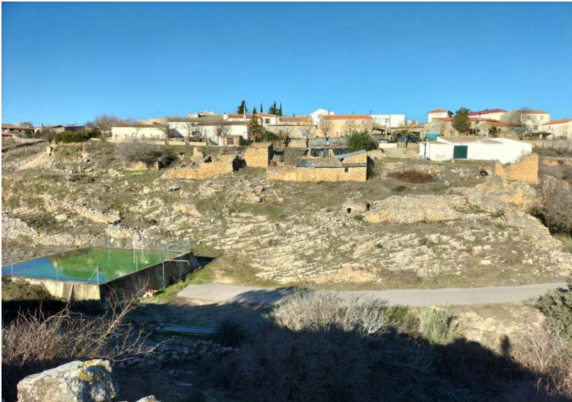
VISTA GENERAL DEL ITUERO. ABAJO, EL ALJIBE

Llegada sobre las diez y media de la mañana al Ituero, (nombre de origen indoeuropeo, del eusquera “Iturri”, aunque en Castilla y León aparece Itero, del latín, que deriva en el topónimo mayor Ituero). Subiremos desde el aljibe hacia el conjunto de curiosos rediles o majás, un conjunto ordenado por calles de piedra junto al río de Masegoso.