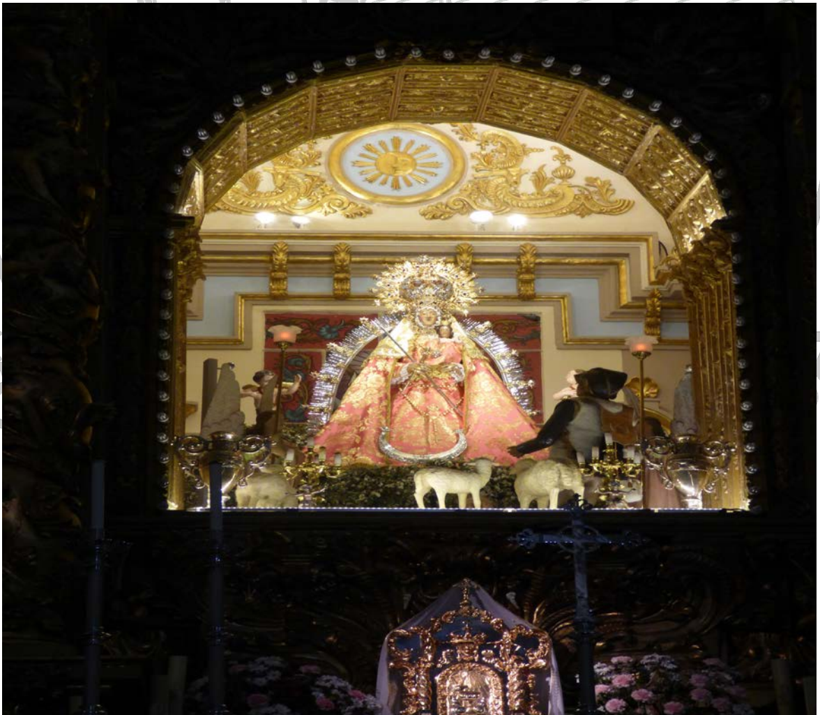
Centro Excursionista de Albacete