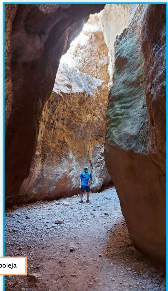
Estrecho de La Arboleja