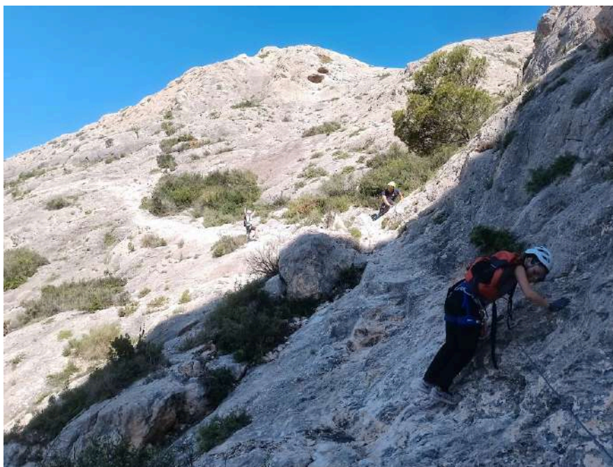
Senda equipada con cable

En el inicio nos encontraremos una senda equipada con cable de acero, que comprende aproximadamente la mitad del trazado de la vía ferrata. Este tramo, que haremos andando por una senda horizontal sin trepar por ningún tipo de peldaño, es ideal para practicar el cambio de mosquetón entre fraccionamientos, y familiarizarnos con la progresión por la vía.