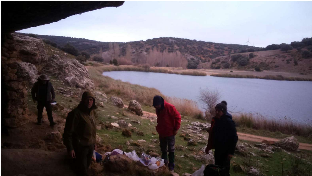
LAGUNA DEL ARQUILLO

Inicia el recorrido desde la pedanía de Ituero (Masegoso) por un sendero al oeste que se dirige a los molinos por el Este. Es el recorrido de los herreros del Ituero, que recorrían los cortijos para herrar a los equinos en el siglo XVIII, XIX y XX de cuyo trabajo se cobraba en especie y más tarde por el sistema de “iguales”. Esta ruta hasta Peñascosa les podía llevar un día entre ida y vuelta.