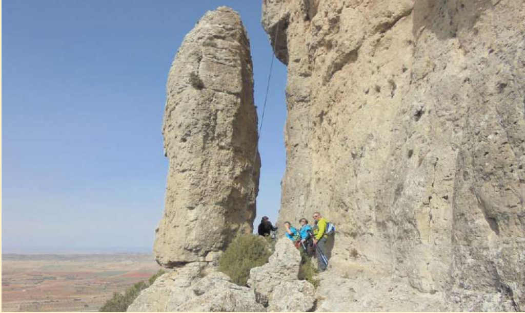
Piedra del Mediodía

La ruta de Carcelén a La Hunde por Palomeras transita por una elevación del terreno que conforma uno de los mayores “calares” de esta comarca. Una elevación de más de 20 km 2 que se extiende por los términos de Carcelén, Alatoz, Alpera y Ayora, con una altitud media de 1100 metros con formaciones erosionadas que dan forma a muelas, puntales, abrigos, cavidades y simas, propias de los calares. En sus laderas fluyen manantiales y fuentes conocidas en toda la comarca (fuente de Los Chorros, Fuente de la Cadena, Fuente del Piojo, Fuente de Sancho, etc) que dan idea de las capacidades de acumulación y filtración de agua que constituyen estos macizos calizos. Además, tienen una gran cubierta vegetal de carrascas, pinos carrascos, sabinars y enebros y tapizados por el matorral de boj, madroño, romero, tomillos, espinos y aliagas. Venados, muflones, cabras, jabalíes, zorros, son habituales en esta zona. Peña Blanca en la Muela de Carcelén