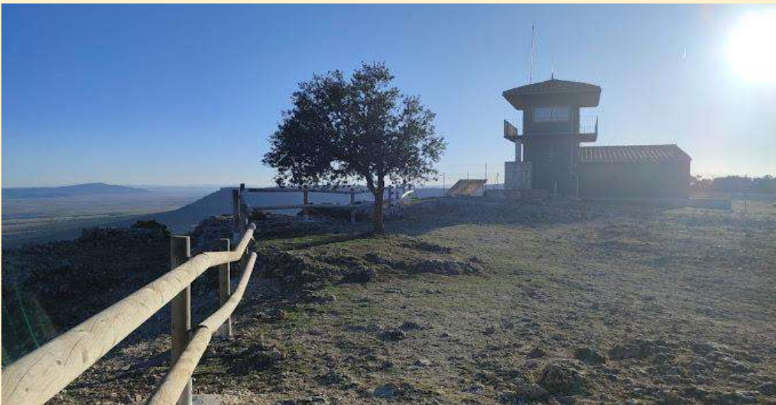
Mirador pico Palomeras

Iniciamos la ruta desde la población de Carcelén subiendo por una empinada pendiente en dirección a “Peña Blanca” en la Muela de Carcelén , pasando por la “ Piedra del Mediodía ” por donde discurre una carrera nocturna tradicional con antorchas cada 23 de agosto, conocida como la carrera de Los Montones . Una vez salvada esta subida continuaremos por el borde de la muela contemplando las vistas de la cañada de Carcelén y sierra del Boquerón buscando el barranco de La Fuentezuela por donde descenderemos hasta la pista de la Dehesa. De nuevo por otra vaguada buscaremos el camino del Corral de la Muela que nos conducirá hasta el mirador de Palomeras. Situado en el extremo más oriental de estas muelas, Palomeras es, sin duda, el mejor mirador panorámico de toda esta comarca. Desde sus 1260 metros en un día claro nos permite visualizar gran parte de las cadenas montañosas de Valencia, Alicante, parte de Murcia y Teruel. A sus pies se extiende la cañada del Paso de Ayora y las sierras del Mugrón y Montemayor.