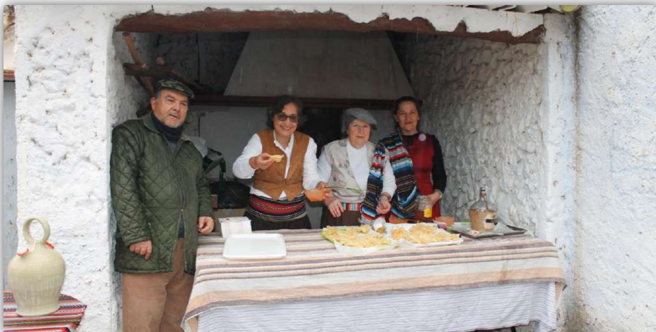
XV Ruta del Roche 2024, reparto de hojuelas y licores en Híjar, Liétor.

Ya dejado atrás Los Infiernos llegaremos a presa del Azud, para subir por el puente de Abajo a Liétor. Al llegar a Liétor celebraremos un ágape en el bar La Parra, antes de visitar por la tarde los tres templos cristianos de esta población, sus casas solariegas y sus miradores por donde esta población se asoma al Mundo.