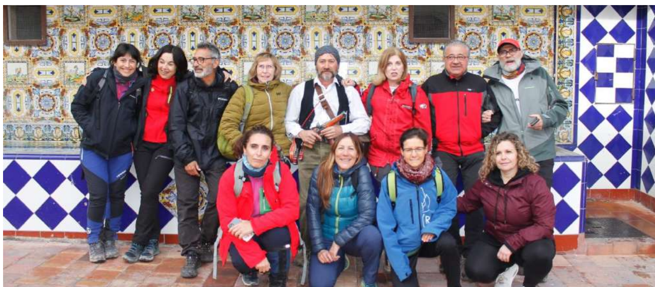
XV Ruta del Roche 2024, fuente del Pilar (Liétor).