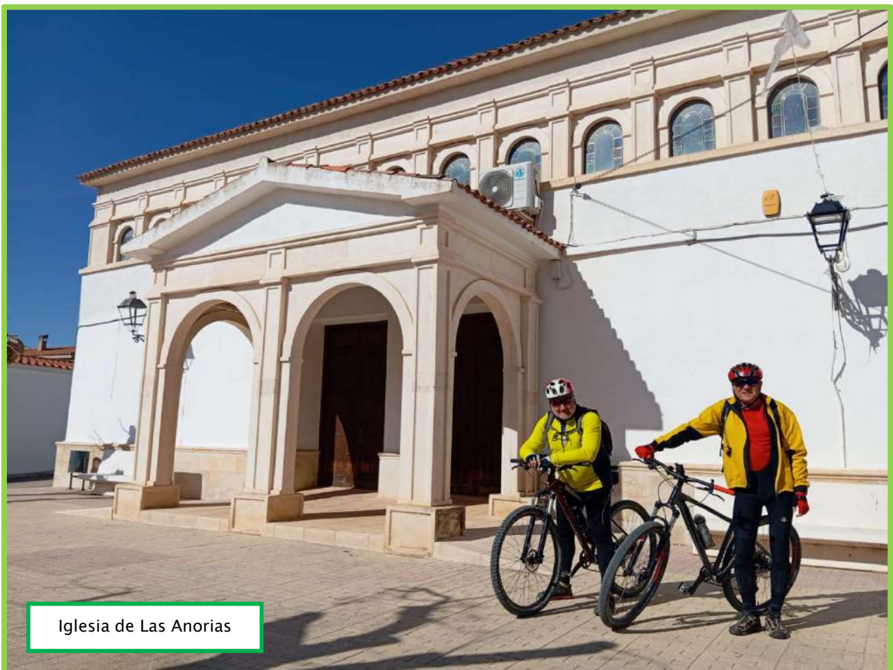
Iglesia de Las Anorias